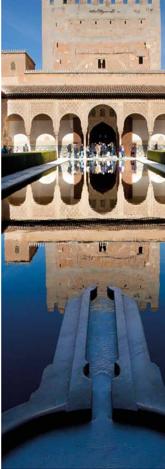
PATIO DE LOS ARRAYANES

LA GASTRONOMÍA. Viajar en el Al Ándalus es recorrer la rica gastronomía española, con sus deliciosos platos que hunden raíces en las tradiciones culinarias de los pueblos que han conformado su historia. Sea a bordo de los salones del tren, o en alguno de los restaurantes que componen la cuidada selección culinaria del viaje, la restauración no le dejará indiferente. Productos de fama mundial como el aceite de oliva, el vino de Jerez o el jamón ibérico de bellota se codean con refrescantes platos como el gazpacho y elaboraciones típicamente andaluzas, como el rabo de toro. La gastronomía de cada zona, siempre regada por los vinos de las mejores denominaciones de origen, imprime su personalidad a los distintos itinerarios, con un perfecto equilibrio entre la cocina tradicional de cada zona, la creatividad de los profesionales y la constante innovación que ha dado fama a la cocina española en todo el mundo.