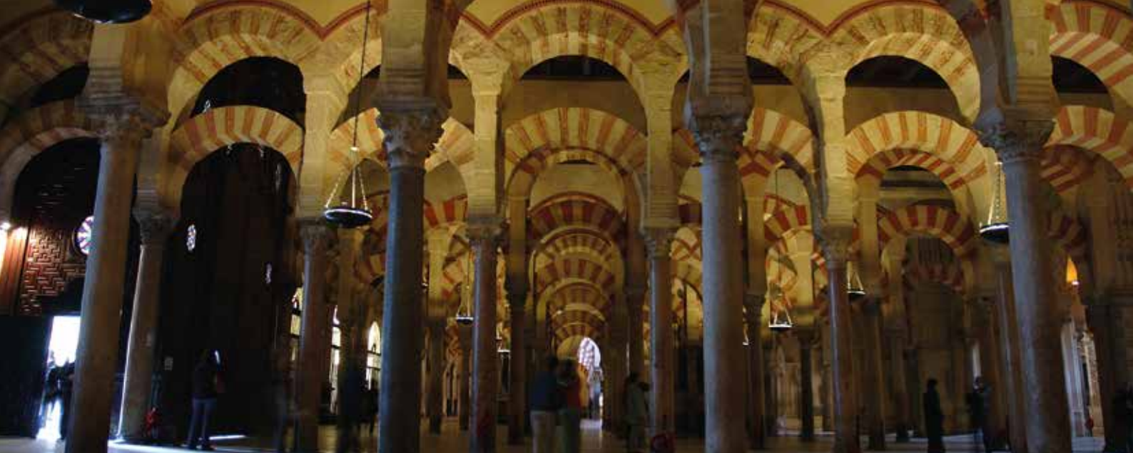
MEZQUITA. CÓRDOBA