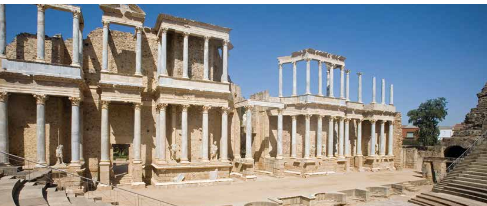
TEATRO ROMANO. MÉRIDA