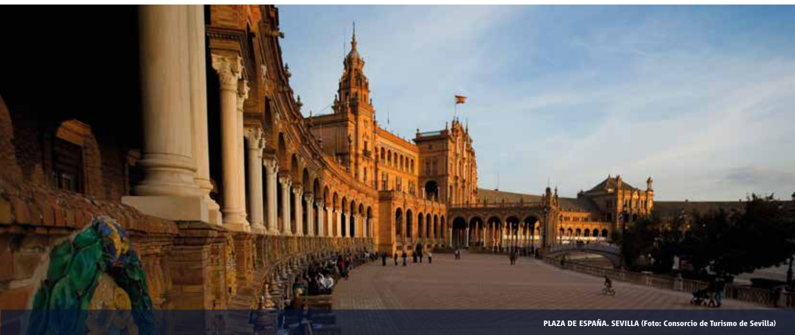
PLAZA DE ESPAÑA. SEVILLA

A lo largo de 7 días y 6 noches llenos de intensidad, nos acercaremos a la esencia de Andalucía de una forma tan original como fascinante, a bordo de un tren de época que hará de nuestro viaje una experiencia inolvidable.