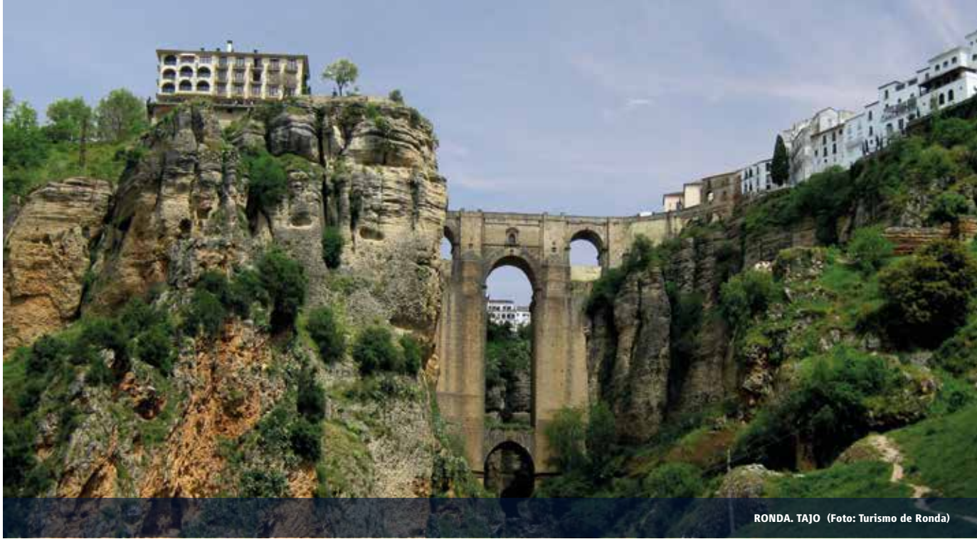
RONDA. TAJO