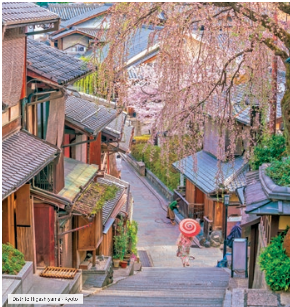
Distrito Higashiyama - Kyoto

Desayuno. A las 08:30 horas, reunión en el lobby. Visita del Templo Asakusa Kannon, el más antiguo de Tokyo, con la calle comercial de Nakamise, el barrio Daiba y un pequeño paseo en barco. Almuerzo en un restaurante local. Tarde libre. Regreso individual al hotel. Alojamiento.