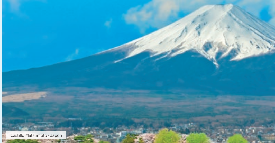
Castillo Matsumoto · Japón