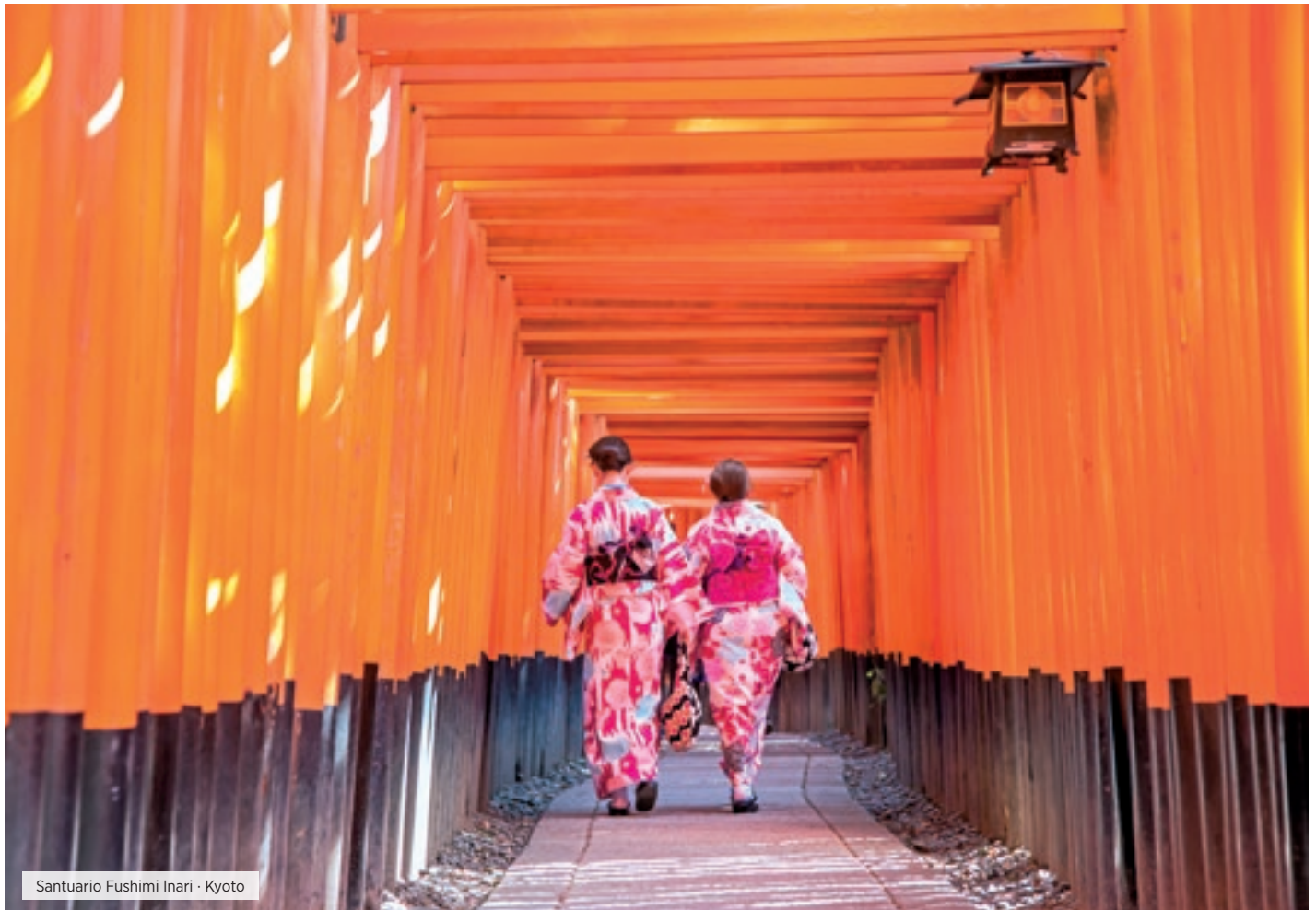
Santuario Fushimi Inari · Kyoto

Desayuno. Entrega del equipaje para trasladar las maletas separadamente (es necesario preparar un equipaje de mano para 1 noche, las maletas llegan al día siguiente). A las 07:30 horas, encuentro en el lobby y traslado a la estación de tren. Salida hacia Himeji en tren bala Hikari. A la llegada se visita el Castillo de Himeji (Patrimonio de la Humanidad), una de las estructuras más antiguas del Japón medieval. Salida hacia Kurashiki por carretera y Almuerzo