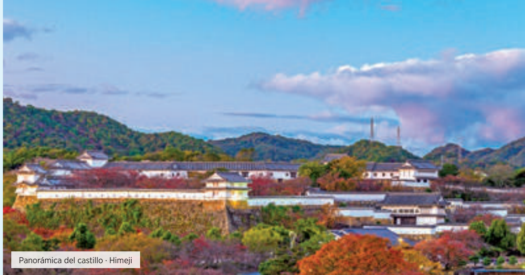
Panorámica del castillo · Himeji