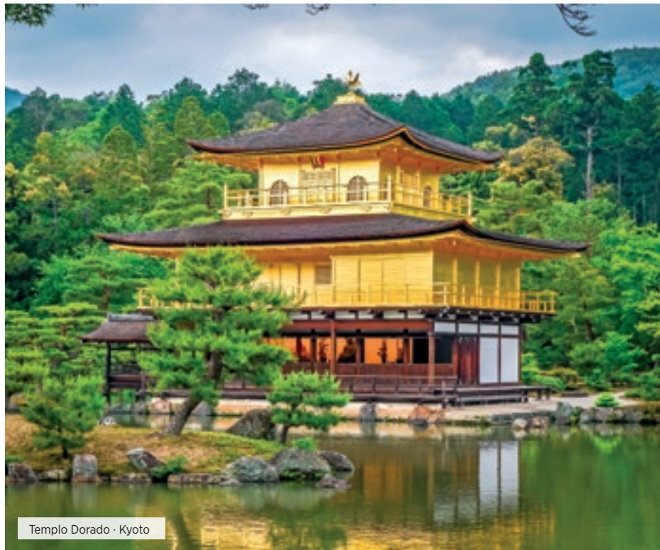
Templo Dorado - Kyoto