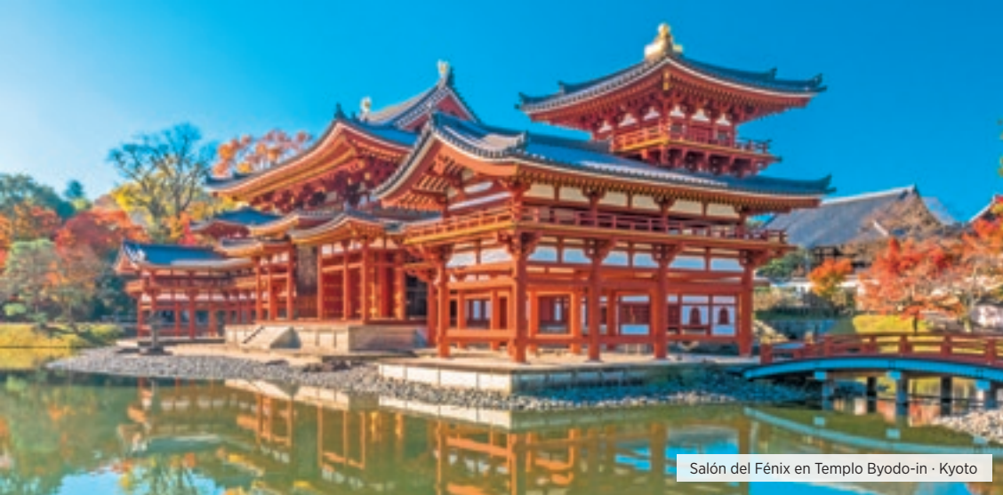
Salón del Fénix en Templo Byodo-in · Kyoto