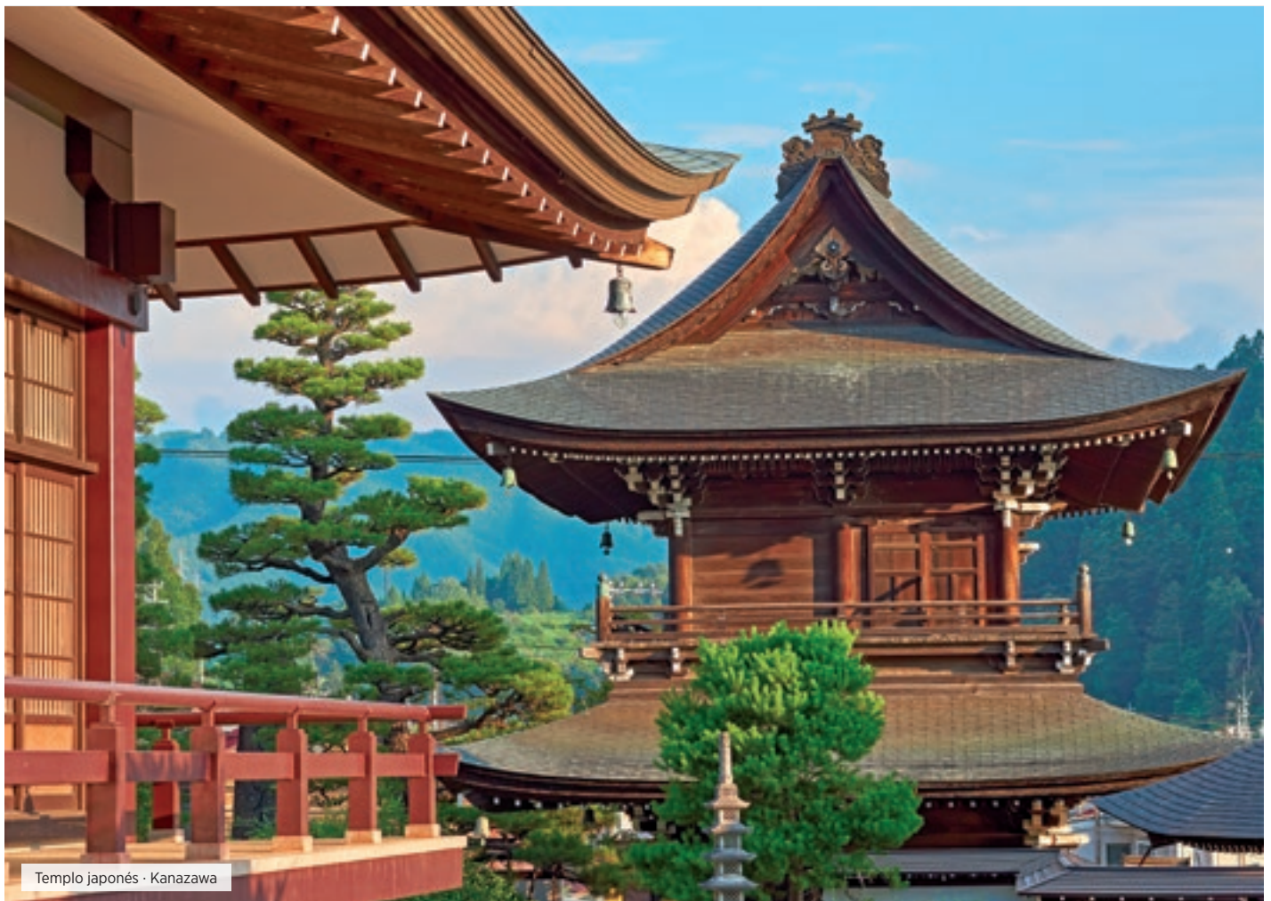
Templo japonés · Kanazawa

Desayuno. A las 08:30 horas, reunión en el lobby y salida hacia el Mt. Fuji por carretera. Subida hacia la 5ª estación situada a 2.305 m sobre el nivel del mar desde donde se