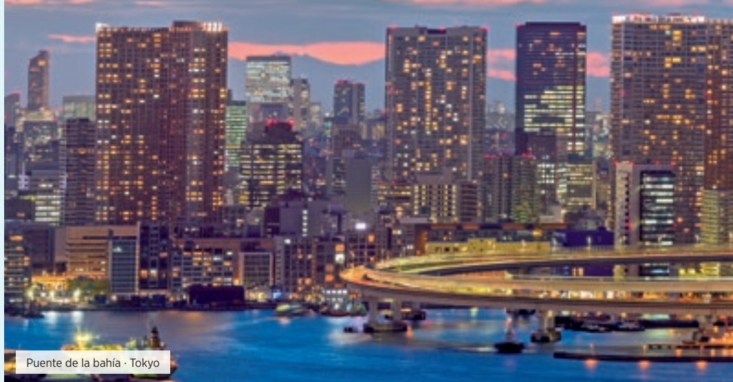
Puenete de la bahía - Tokyo