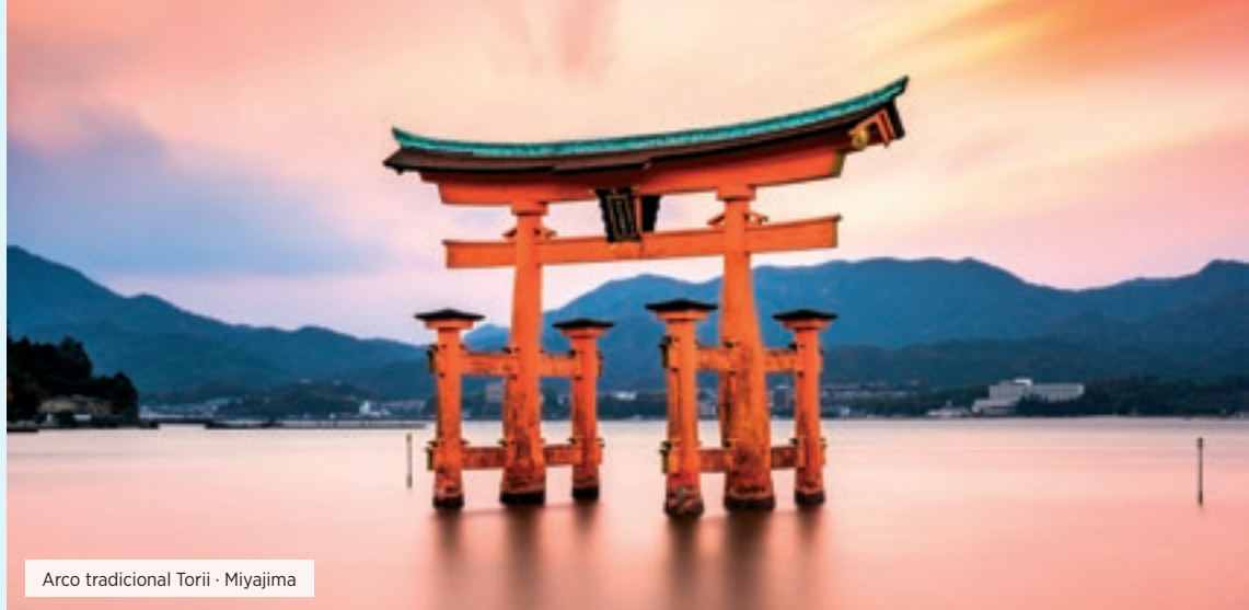
Arco tradicional Torii · Miyajima