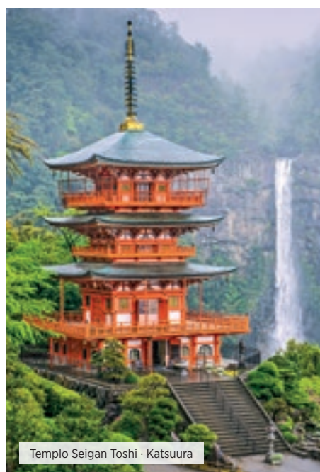
Templo Seigan Toshi · Katsuura

Desayuno. Nuestro personal en Japón les entregará días antes billetes de shuttle bus para el traslado individual al aeropuerto Narita o Haneda que se realiza sin asistencia. La recomendación para salir a los aeropuertos es 4 horas antes de operación. Para Narita 06:30, 07:00, 08:05, 09:05, 11:30, 12:30, 13:30, 14:30, 15:30 y 16:30 horas y para Haneda 07:05, 10:50, 16:50 y 19:50 horas. Es importante tenerlo en cuenta para su previsión de salida al aeropuerto en función del horario de su vuelo. Si el vuelo sale después de las 19:30 horas del aeropuerto de Narita o de las 12 de la noche del aeropuerto de Haneda y no desea tomar un horario del shuttle anterior, puede solicitar un traslado adicional en taxi con chófer en inglés (sin asistencia) con un suplemento de 200 USD aprox. por persona y para un máximo de 2 personas por taxi. Fin de nuestros servicios. ■