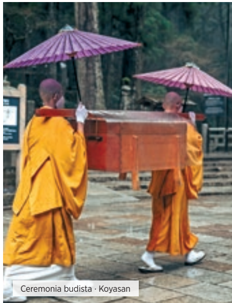
Ceremonia budista · Koyasan

Desayuno. A la hora indicada, traslado en limusine bus sin asistencia. El guía entregará los billetes del bus unos días antes. El Airport Limousine Bus sale desde la terminal de autobuses que está ubicada al lado del Sheraton Miyako Osaka cada 30 minutos hacia el aeropuerto de Kansai (KIX) y al aeropuerto de Itami (ITM) que se encuentran a unos 50 y 40 minutos respectivamente de Osaka. Fin de nuestros servicios. ■