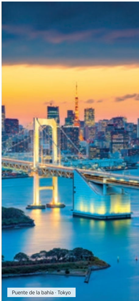
Puente de la bahía · Tokyo

Desayuno. Traslado al aeropuerto internacional de Narita en transporte regular, con asistente de habla española. Fin de nuestros servicios. ■