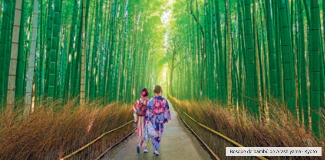
Bosque de bambú de Arashiyama · Kyoto