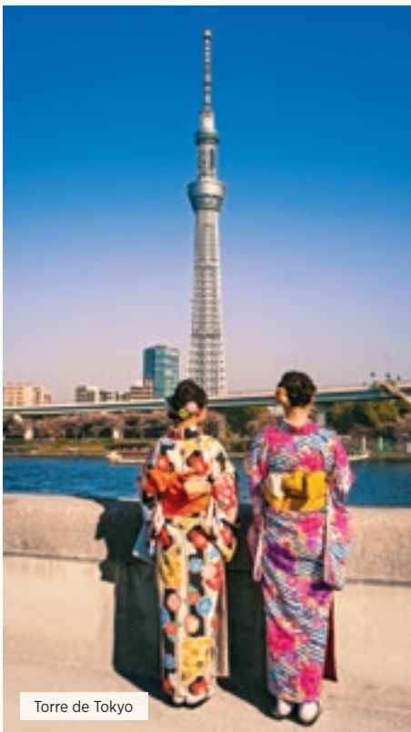
Torre de Tokyo

Desayuno. Comenzaremos la visita de la ciudad por el Templo de Asakusa Kanon (Senso-ji), el más antiguo de Tokyo con su arcada comercial de Nakamise, el templo está dedicado a la Diosa Kanon (Diosa de la Misericordia), y continuamos por el moderno barrio Odaiba, desde donde tenemos una vista espectacular de la bahía de Tokyo y el Rainbow Bridge. Almuerzo en un restaurante local y, seguidamente, realizaremos un recorrido en barco por la bahía. Para finalizar, visitaremos el barrio de Shibuya donde se encuentra el famoso cruce, la intersección más famosa del mundo, en donde miles de personas cruzan en todas direcciones. El tour finaliza en Shibuya, donde se puede ir de compras ya que hay miles de pequeñas tiendas y también grandes almacenes. Es una zona muy animada en la noche japonesa. Regreso individual al hotel. Alojamiento.