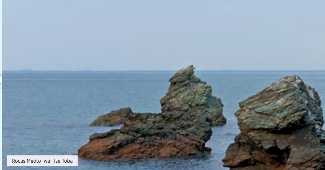
Rocas Meoto Iwa · Ise Toba