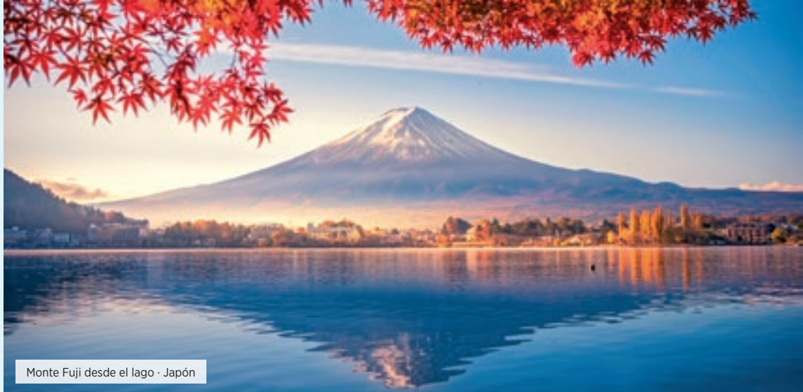
Monte Fuji desde el lago · Japón